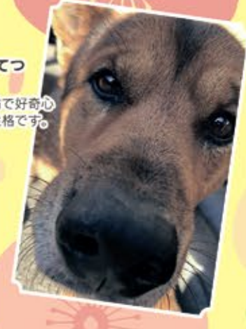
入家こてつ オス 甘えん坊で好奇心旺盛な性格です。