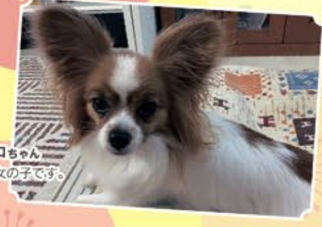
パピヨンのモコちゃん 2歳 かわいい女の子です。