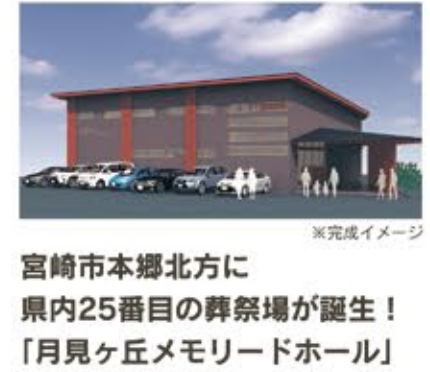
宮崎市本郷北方に 県内25番目の葬祭場が誕生！ 「月見ヶ丘メモリードホール」