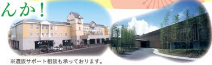
※遺族サポート相談も承っております。

婚礼施設6施設。葬祭施設25施設。見学したい施設と希望日、時間をご記入の上、ハガキを投函してください。後日担当者よりご連絡致します。 ※施設の利用状況によりご希望日に見学できない場合もございます。