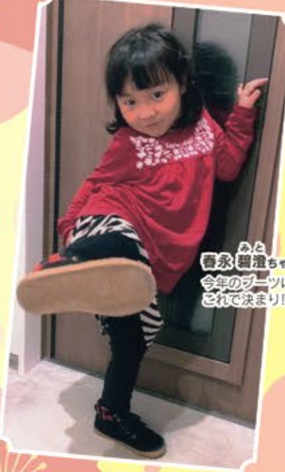
みと 香永 楓ちゃん 今年のブーツはこれだまり！！